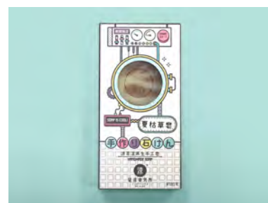
3. 夏枯草皂 / 單件裝 (80克)