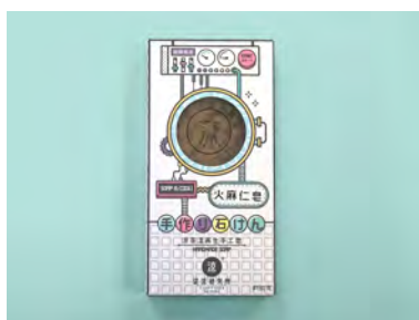
2. 火麻仁皂 / 單件裝 (80克)